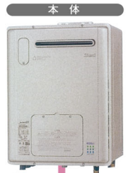
リンナイ RVD-E2405SAW2-1 (A)