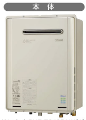
リンナイ RUF-E2405AW (A)