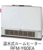
温水式ルームヒーター RFM-Y60EA