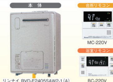
リンナイ RVD-E2405SAW2-1 (A)