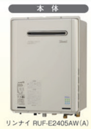
リンナイ RUF-E2405AW (A)